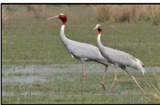
S..... đầu đỏ