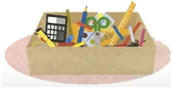
Hình 1. Đồ dùng chưa được sắp xếp

1. Em hãy quan sát hai hình sau đây và cho biết, khi An cần tìm cục tẩy thì cách để đồ ở hình nào giúp An tìm nhanh hơn? Khoanh tròn vào hình mà e lựa chọn.